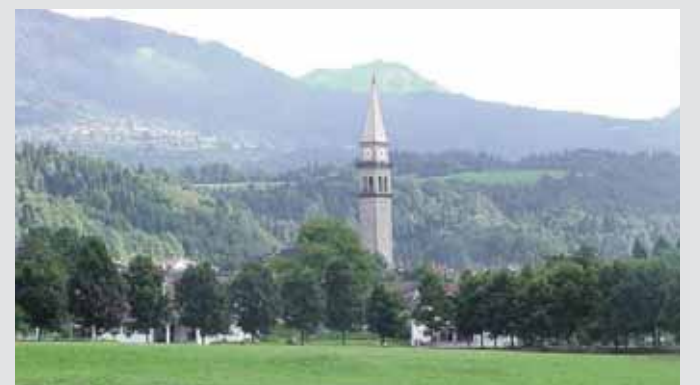
Enemonzo: la terra delle radici

Purtroppo, la Nazione-Stato di Westfalia fece dell'identità singola la propria arma segreta, assieme alla necessità del "nemico esistenziale". L'interdipendenza a livello globale sta portando alla luce il fatto che siamo tutti portatori di molteplici identità. Ripeto ancora: senza questa forma mentis non solo non avrei potuto salvare vite umane, ma non sarei uscito vivo né dal Libano né dall'Iraq.