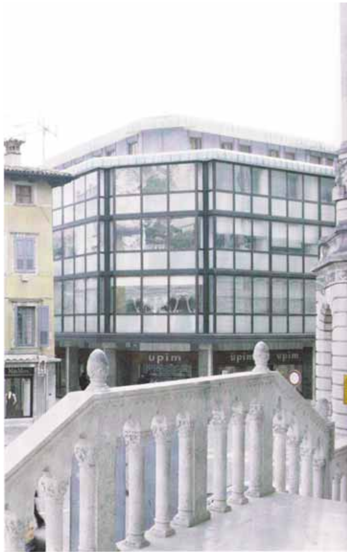
... e il dopo