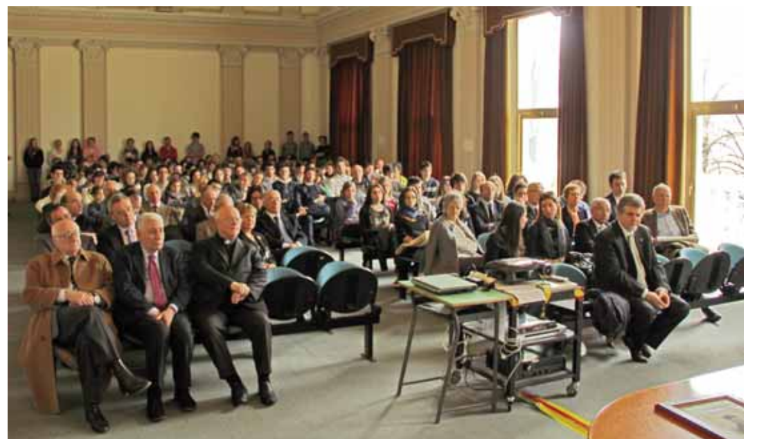
L'Aula Magna durante lo svolgimento del seminario