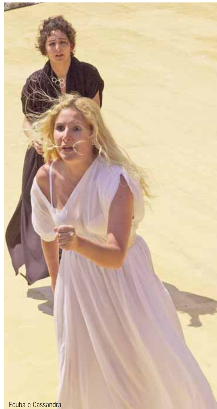
Ecuba e Cassandra

Per quanto riguarda l'obiettivo finale di questo progetto, e cioè recitare nel teatro di Palazzolo Acreide, ero spaventata. Ero già salita, è vero, su un palcoscenico, ma solo per danzare, e inoltre a teatro, quando si alza il sipario e si abbassano le luci, il pubblico rimane invisibile a chi sta sul palco. In un teatro greco, invece, la situazione è molto diversa: l'attore è perfettamente consapevole della gente che lo sta a guardare e ne vede le reazioni. Per questo temevo, ma non era solo mio questo timore, che sarei rimasta bloccata danneggiando lo spettacolo e il gruppo intero. Alla fine, per fortuna, non è successo niente del genere.