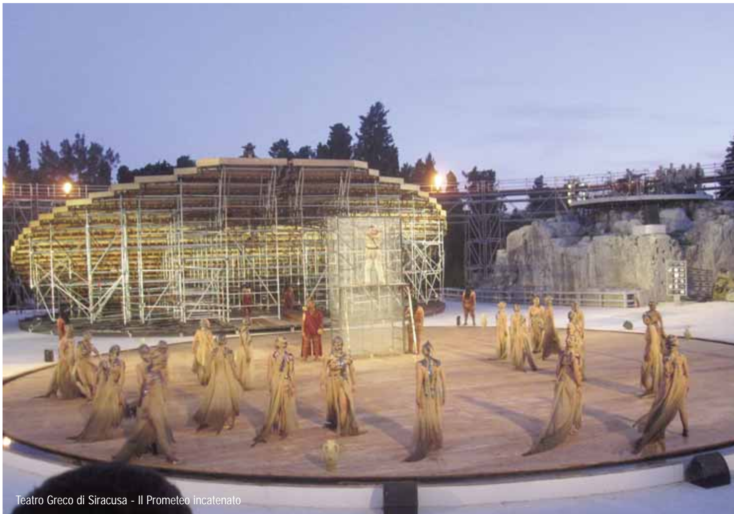
Teatro Greco di Siracusa - Il Prometeo incatenato